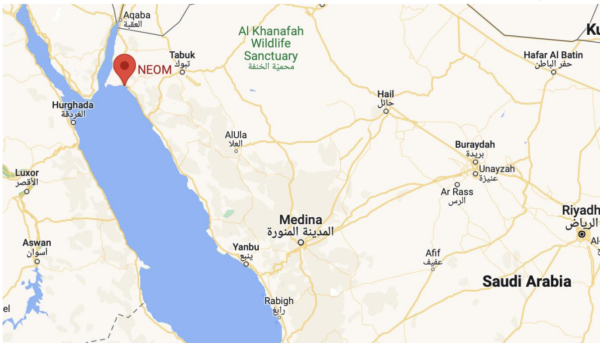
نقشه شماره ۱ (موقعیت جغرافیایی پروژه نئوم؛ ماخذ: www.acwapower.com )

همچنین این پروژه را می‌توان مکانی در نظر گرفت که رفاه مردم و آینده طبیعت را در اولویت قرار می‌دهد و مدل جدیدی برای زندگی پایدار، کار و شکوفایی ایجاد می‌کند. (vision2030,2023:1). نزدیک به ۲۰ درصد از کارهای زیرساختی در این پروژه که به شهر آینده نگر نیز مشهور است با هزینه کرد ۵۰۰ میلیارد دلاری عربستان سعودی تکمیل شده است. پروژه بزرگ عربستان اشاره به انرژی پاک، محیط زیست بدون خودرو و خیابان و عدم انتشار کربن دارد، (livemint,2023:2).